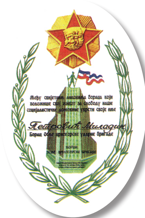
Спомен-плакета издата 19. октобра 1989, четрдесет пет година после подвига борца из Непричаве.