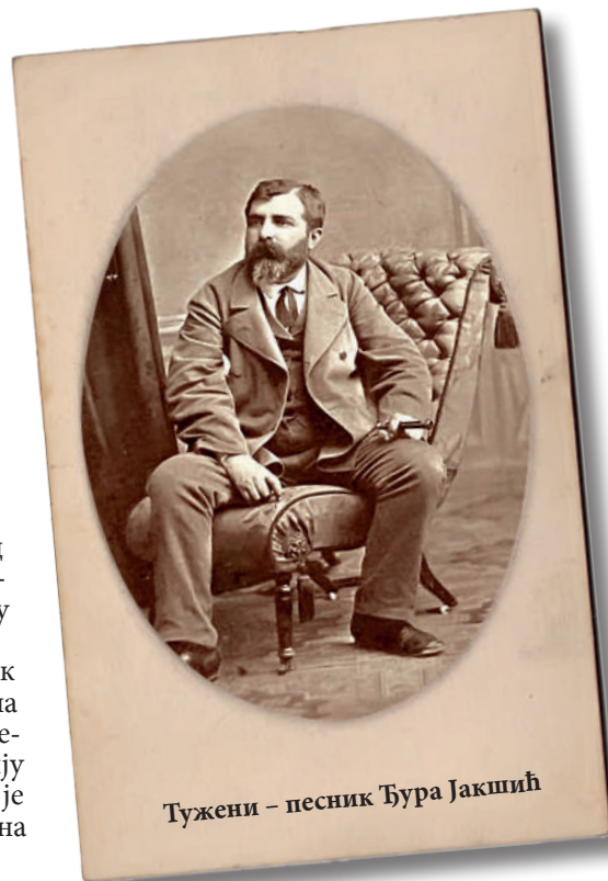
Тужени – песник Ђура Јакшић

У присуству мноштва истомишљеника и пријатеља, песник Ђура Јакшић је дрхтавим гласом – што