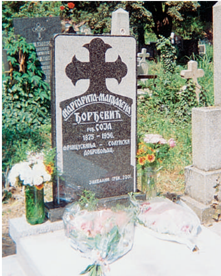
Данашњи изглед гроб Маргарите Магдалене